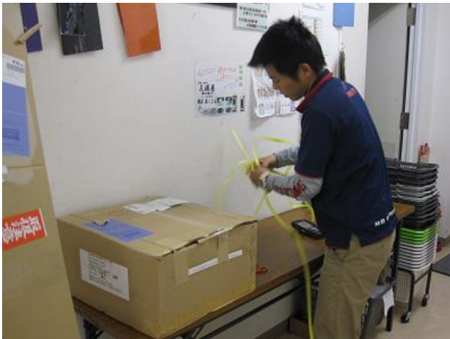
とど しょうひん こんぽう あ 届いた商品の梱包を開けます。