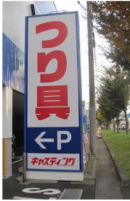
キャストイングは、全国に50店舗以上を構える おおがた つり くてん 大型の釣り具店です。

《キャストイング 泉パイパス店》 いずみ てん ばしよ せんだいいしずみくてんじんさわ 場所：仙台市泉区天神沢1-1-27 へいせい ねん がっげんざい （平成28年11月現在）