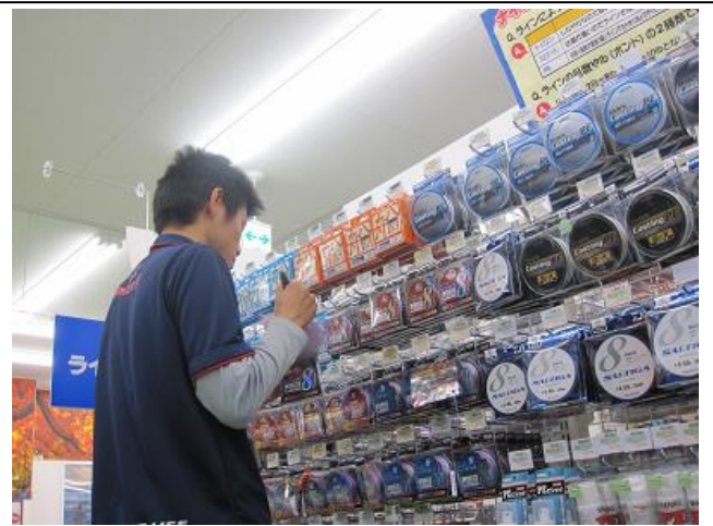
たな なら しょうひん ほこりと おこな 棚に並んだ商品の埃取りを行っています。