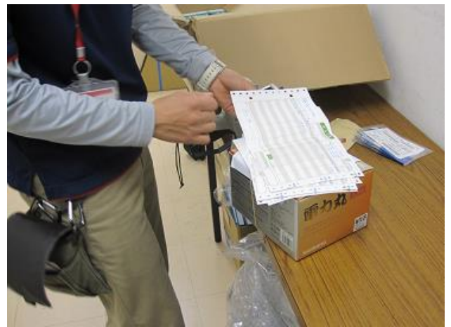
とど しょうひん でんびょう ちが 届いた商品が伝票と違わないかチェックします。