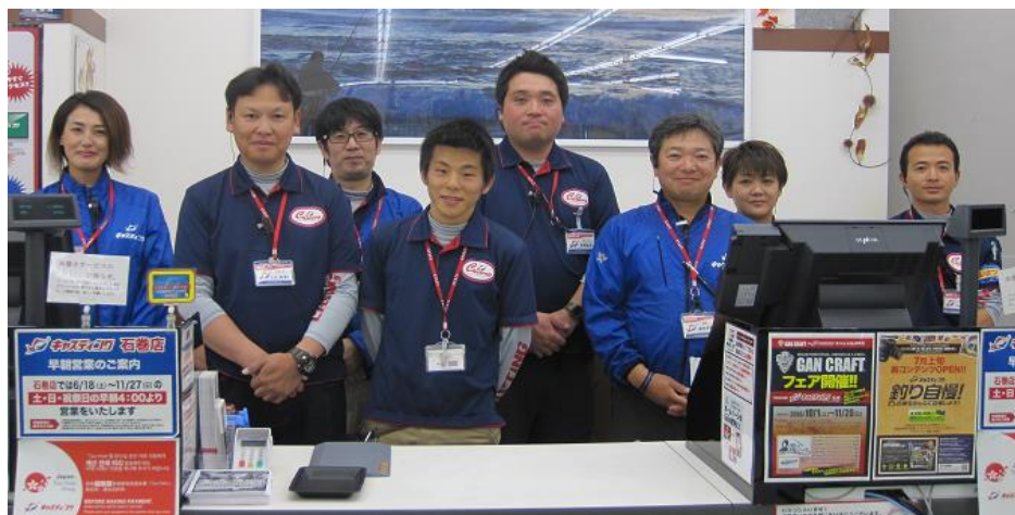
キャストイング いずみ てん みな えがお あいさつ さわ 泉パイパス店の皆さん 笑顔と挨拶がとても爽やかです。