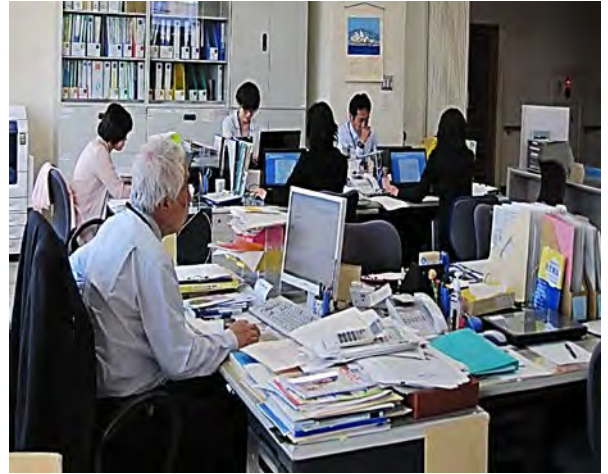
《写真はセンターの様子》

※ ジョブコーチは、仙台市知的障害者非常勤嘱託職員のジョブコーチとして仙台市役所の場所にて勤務しております。